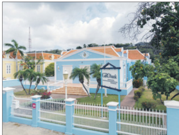
GSH heeft in het kader van de afwikkeling de uitstaande leningen van Girobank overgenomen en zal deze leningen verder beheren en innen.

Het is onduidelijk waarom Girobank - waarvoor het Land Curaçao (lees: de burgers) in verband met de geplande liquidatie een lening van 170 miljoen gulden is aangegaan bij de Nederlandse staat en waarvoor de CBCS circa 270 miljoen aan voorschotten verleende, die de komende jaren door dezelfde burgers terugbetaald moet worden - geen informatie wenst te geven over het saldo aan tegoeden en spaargelden van rekeninghouders.